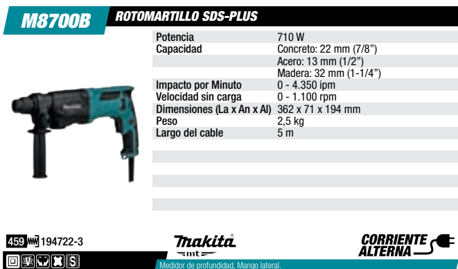
Rotomartillo SDS-PLUS 22 mm, 710 W, 0-1.100 rpm