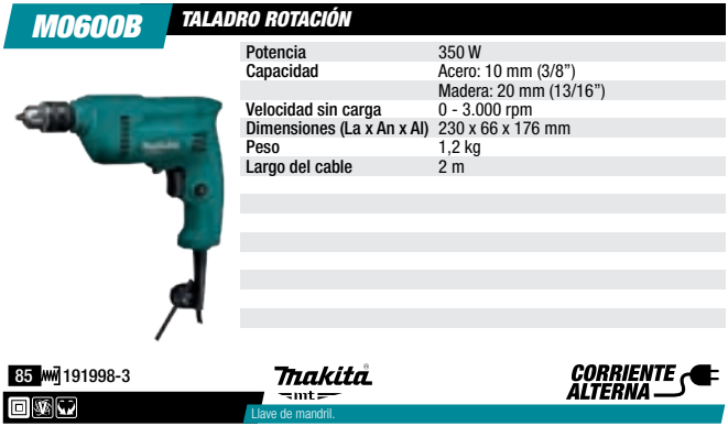
Taladro rotación 10 mm, 350 W, 0-3.000 rpm