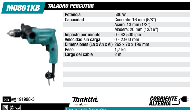
Taladro percusión 13 mm 500 W, 0-2.900 rpm.