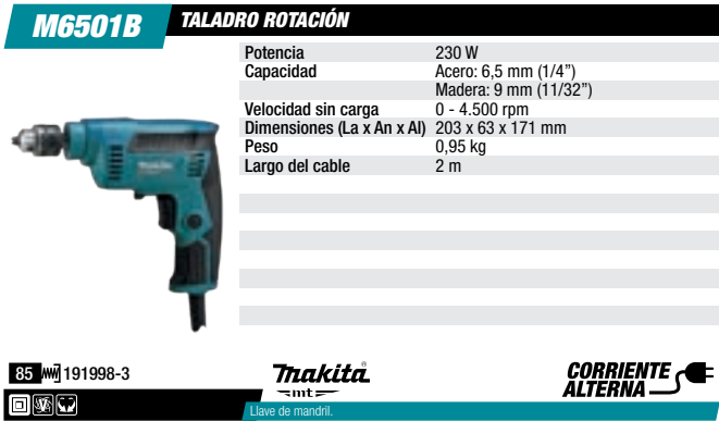
Taladro rotación 6,5 mm, 230 W, 0-4.500 rpm