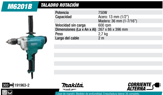
Taladro rotación 13 mm, 750 W, 600 rpm